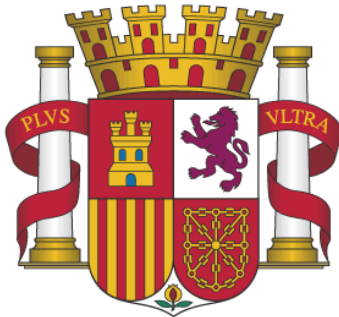
Escudo de la II República Española.

Hablar de República es llevar a lomos de mulas la alfabetización, la literatura o el teatro hasta los lugares más recónditos . Hablar de cultura como pilar fundamental para el desarrollo de una sociedad.