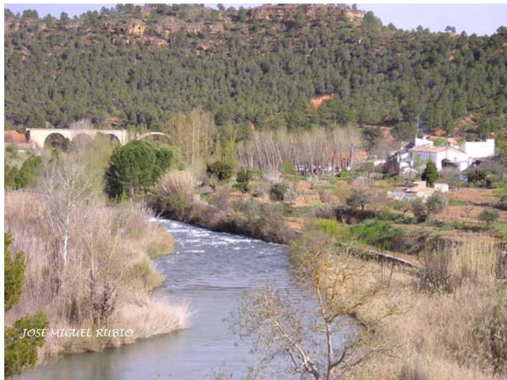
El río Cabriel.

comarca: Villamalea, Casas Ibáñez, Alborea, Villatoya, Abengibre entre otros. A la vez que mantiene contactos con otros pueblos ribereños del Río Cabriel en las provincias de Cuenca y Valencia con problemática parecida: Venta del Moro, Minglanilla, Villalpardo, y otros.