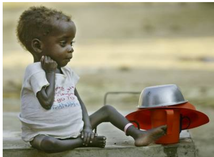
12.000 niños mueren de hambre al día y no es noticia.

Por ello no hay medio que a esos doce mil muertos les dedique un breve titular, una triste crónica, acaso una reseña en la sección de “Mundo insólito”.