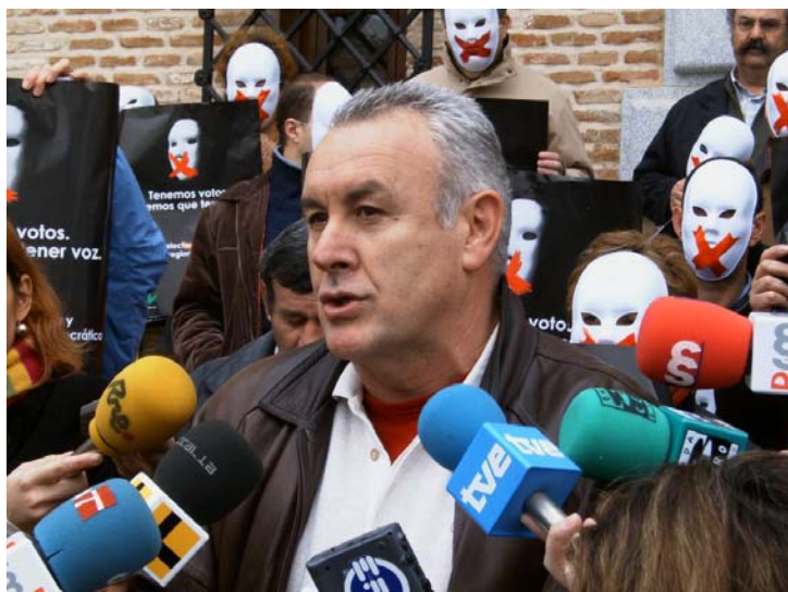
Cayo Lara, Coordinador de I.U. en Castilla-La Mancha.

El coordinador regional de IU en Castilla-La Mancha, Cayo Lara, mostró en Cuenca su sorpresa por que la formación que dirige no haya sido incluida en el Consejo Regional del Agua, dado que el presidente autonómico, José María Barreda, le garantizó que iba a formar parte de dicho órgano.