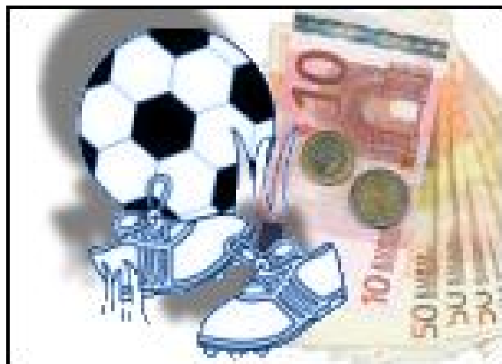
“Políticas, deportes y dineros”

Nadie está en contra de nada, nadie es enemigo de nada ni de nadie, y mucho menos de un deporte tan popular como el fútbol. Y el que esté divulgando otra cosa distinta, no les quepa la menor duda de que algún interés busca. Hemos terminado acostumbrándonos a sus manipulaciones y a sus correveidiles. Solamente se trata de que los pocos o los muchos recursos que haya se repartan de una forma justa y equitativa, bien entre todos los demás deportes (la misma escuela de fútbol anda bastante escasa de recursos) o bien entre otras cosas de las que estamos bastante escasos.