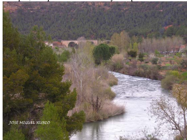
El río Cabriel.

Si hemos de apostar por proyectos de turismo de naturaleza, han de ser proyectos más respetuosos, que surjan desde los mismos pueblos de la comarca y que a nadie nieguen el derecho a disfrutar de los espacios públicos. Un monte vallado es un monte perdido para siempre, del que los ciudadanos ya no podrán disfrutar.