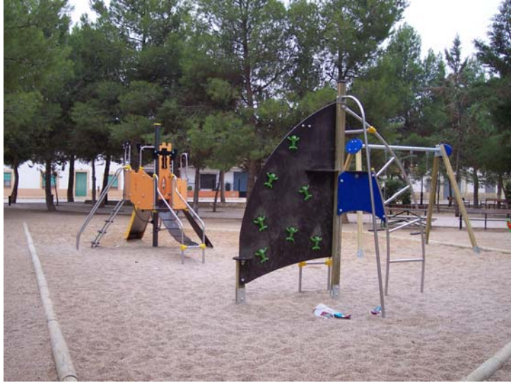
Nuevas instalaciones en los parques infantiles de Villamalea.

gobernantes municipales, nunca han tenido en cuenta una propuesta de otros partidos, y nunca la tendrán).