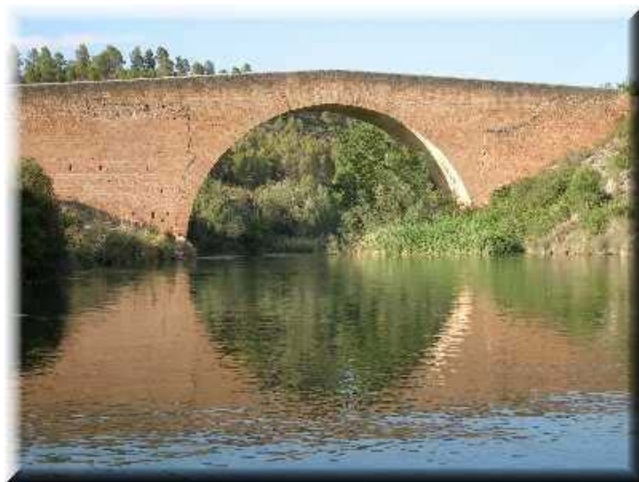
Puente de Vadocañas, en el río Cabriel.

Altos del Cabriel se llaman nuestros vinos y aceites. Río Cabriel se llama nuestro Instituto de Secundaria. Rueda del Cabriel la Sociedad de Pescadores. Y una calle de nuestro pueblo se llama Río Cabriel.