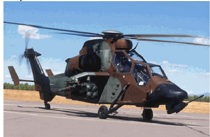
Helicóptero Tigre, una perfecta máquina de asesinar.

Ambos misiles están fabricados por dos empresas relacionadas directamente con EADS, el gigante europeo de la aeronáutica. El primero de ellos está fabricado por el consorcio Euromissile, y el segundo por MBDA. Ambas son empresas y programas europeos.