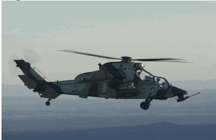
Helicóptero Tigre, perfecta máquina de asesinar.

4. Estas armas ni valen frente al terrorismo internacional, ni resulta fácil ver cómo pueden ser útiles en las llamadas intervenciones humanitarias. Más bien el llamado I+D militar responde a complejos industriales-militares (grupos de presión formados por políticos, industriales y militares). De hecho, en ocasiones, los nuevos armamentos no son necesarios ni siquiera desde el punto de vista estrictamente militar, y se desarrollan exclusivamente debido a la presión que ejercen esos complejos sobre los gobiernos.