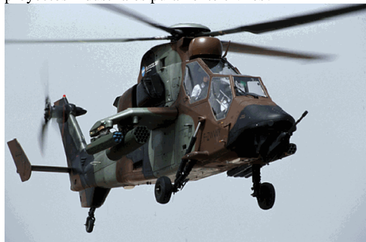
Helicóptero Tigre, una perfecta máquina de asesinar.

¿Por qué no hace el alcalde esfuerzos para captar proyectos industriales puramente civiles?